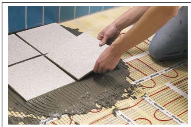
Рис. 3. Монтаж нагревательного мата DTIR-150 в ванной комнате на старую плитку.